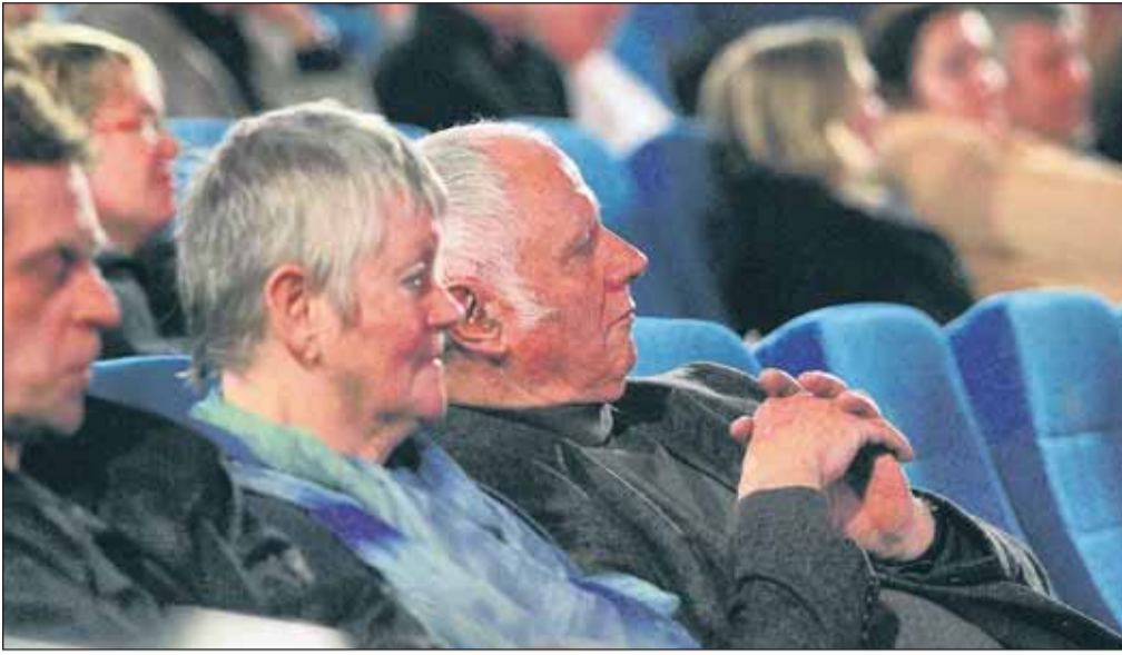
So fesselnd kann ein Film über einen Friedhof sein. Die Kinobesucher genießen gebannt die eindrucksvollen Bilder aus Berlin-Weißensee.